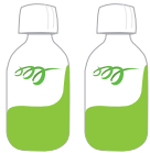
CLENPIQ 2병 (각 5.4oz)