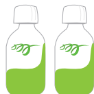
Dos frascos de CLENPIQ (de 5.4 oz cada uno)